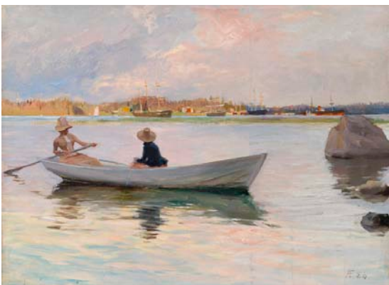
Albert Edelfelt: Tyttöjä veneessä (1886) / Kansallisgalleria

Albert Edelfeltin sekä Pariisissa että Göteborgissa menestynyt näyttely saapuu toukokuussa Ateneumin taidemuseoon. Näyttely esittelee Suomen tunnetuimpiin taiteilijoihin kuuluvan Edelfeltin kansainvälisestä näkökulmasta. Näyttely on avoinna Ateneumin taidemuseossa 5.5. – 17.9.2023.