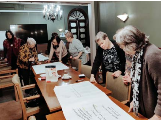
Oulun naisliittolaisten vuoden 2023 ideointia työpajassa jäsenkyselyn pohjalta.