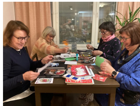
Muistelukorttien askartelua.

saivat kovin myönteisen vastaanoton ja menivät heti aktiiviseen käyttöön. Hoitajat olivat mielissään ja tyytyväisiä näistä ”työkaluista”, jotka auttavat kontaktin saamisessa ja keskustelun herättämisessä muistisairaiden kanssa.