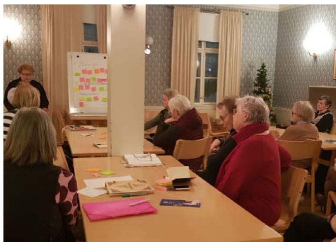
Torniolaisten jäsentapaamisen ideoiden yhteenvetoa.