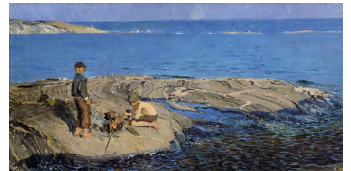
Venny Soldan-Brofeldt, Pojat luodolla (Porkkalasta), 1898, öljy, Järvenpään taidemuseo.

Vuonna 2021 Järvenpään taidemuseon kevään ja kesän näyttelyssä keskitytään Venny Soldan-Brofeldtin ja Hugo Backmanssonin taiteeseen. Nämä kaksi taiteilijaa kuvasivat molemmat omilla tahoillaan merta ja taivasta sen lukematomissa eri väreissä. Siinä missä Soldan-Brofeldtin taiteessa näkyi suomalainen rannikkomaisema, näkyi Backmanssonin töissä Marokon