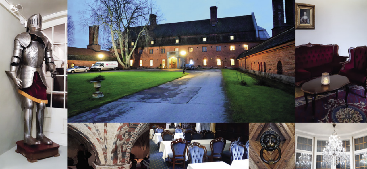
Vanajanlinnan miljöötä.