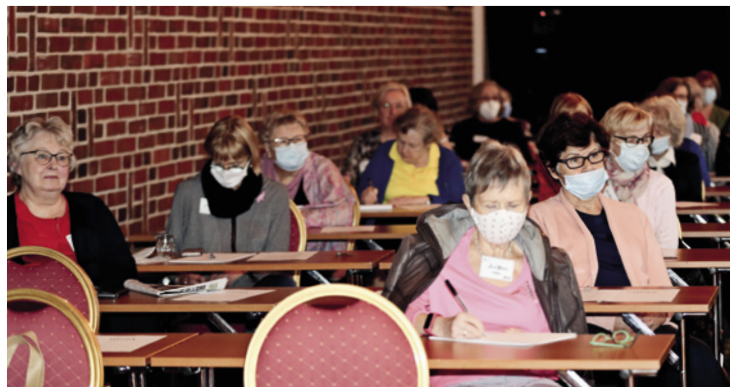
Koronasyksyn seminaarissa ja kokouksissa huolehdittiin turvaväleistä ja käytettiin kasvomaskeja.

Naisten Ääni -verkkojulkaisun suojelijoiksi pyydettiin vuonna