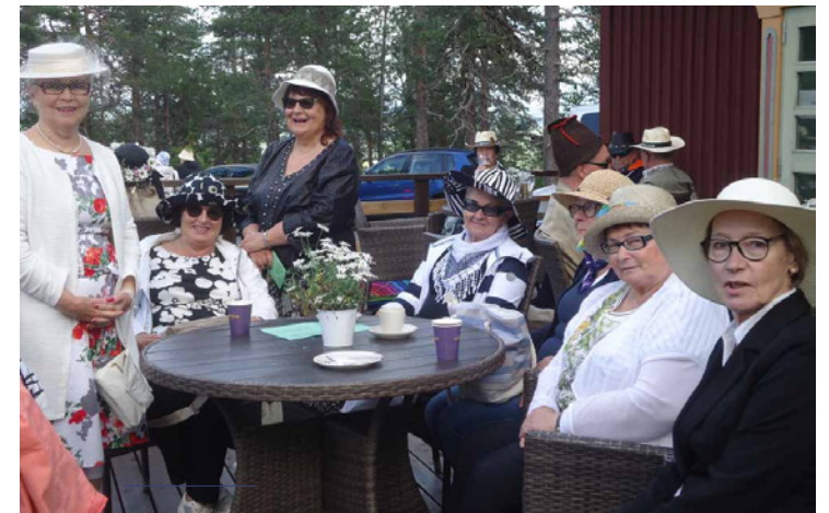
Tornion yhdistyksen naisia hattuineen.