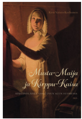
RAILI ILOLA

aiheena eivät suinkaan olleet seksisyyttä tekevät naiset vaan palveluiden takaa, saarella toimineen miehisairaalan ajoilta. Heikkinen ryhtyi ostavien miesten tarrantauhka. Tarkastuskirjaan merkittiin 164 turkulaisen naisen tiedot. Keitä he olivat? Musta-Maija ja Kirppu-Kaisa kertoo näiden rahvaan tyttärien, tarkastusnaisten, tarinan aina lapsuudesta kuolemaan saakka sekä tiedot siitä yhteiskunnasta, jossa nämä naiset elivät. Teos on samalla tietokirja suomalaisen syrjäytymisen historiasta 1800-luvun yhteiskunnassa.