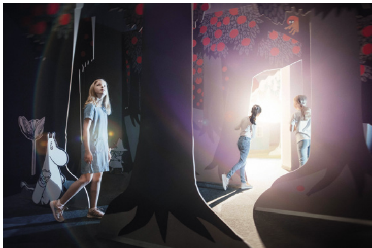
©MOOMIN CHARACTERS™

Kansallismuseon näyttely on taianomainen matka muumien elämänavoihin ja filosofiaan. Näyttely on samaan aikaan nostalginen, lohdullinen ja ilahduttava. Kuten Tove Janssonin kirjatkin, näyttely on suunnattu kaikenikäisille. Näyttelyn yhteydessä järjestetään yleisöopastuksia, työpajoja ja keskustelutilaisuuksia näyttelyn keskeisistä