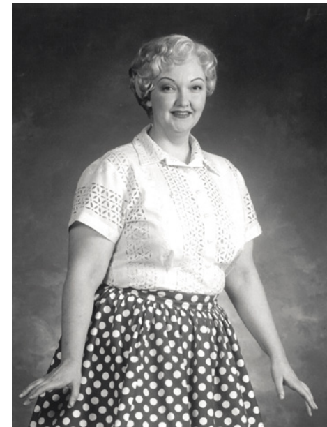
Tango veressä, 1994.

– Tiesinkö jo pienenä, että minustakin tulee näyttelijä? Kenties. Olin toki jo pikkutyttönä teatterissa silloin tällöin avustajana. Se oli