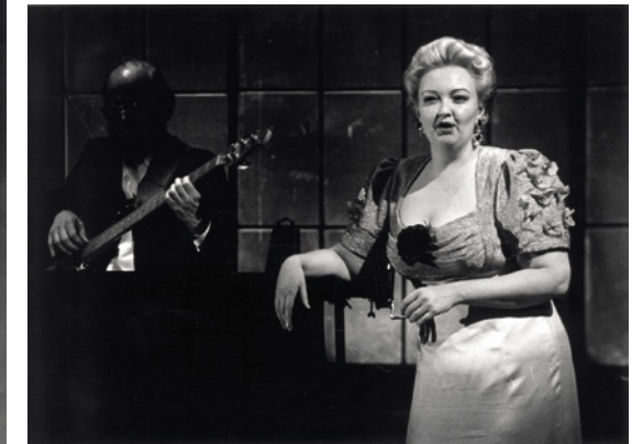
Its's Allright With Me, 1994.