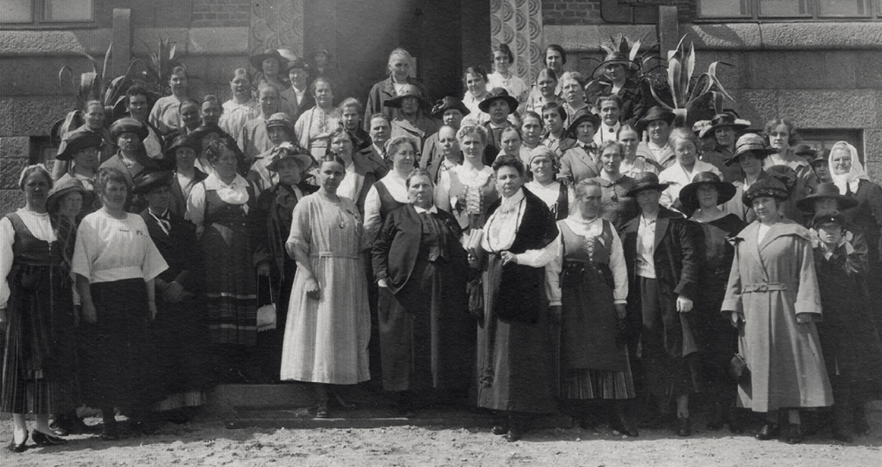
Naisliittolaisia kesäkokouksessa 1923.