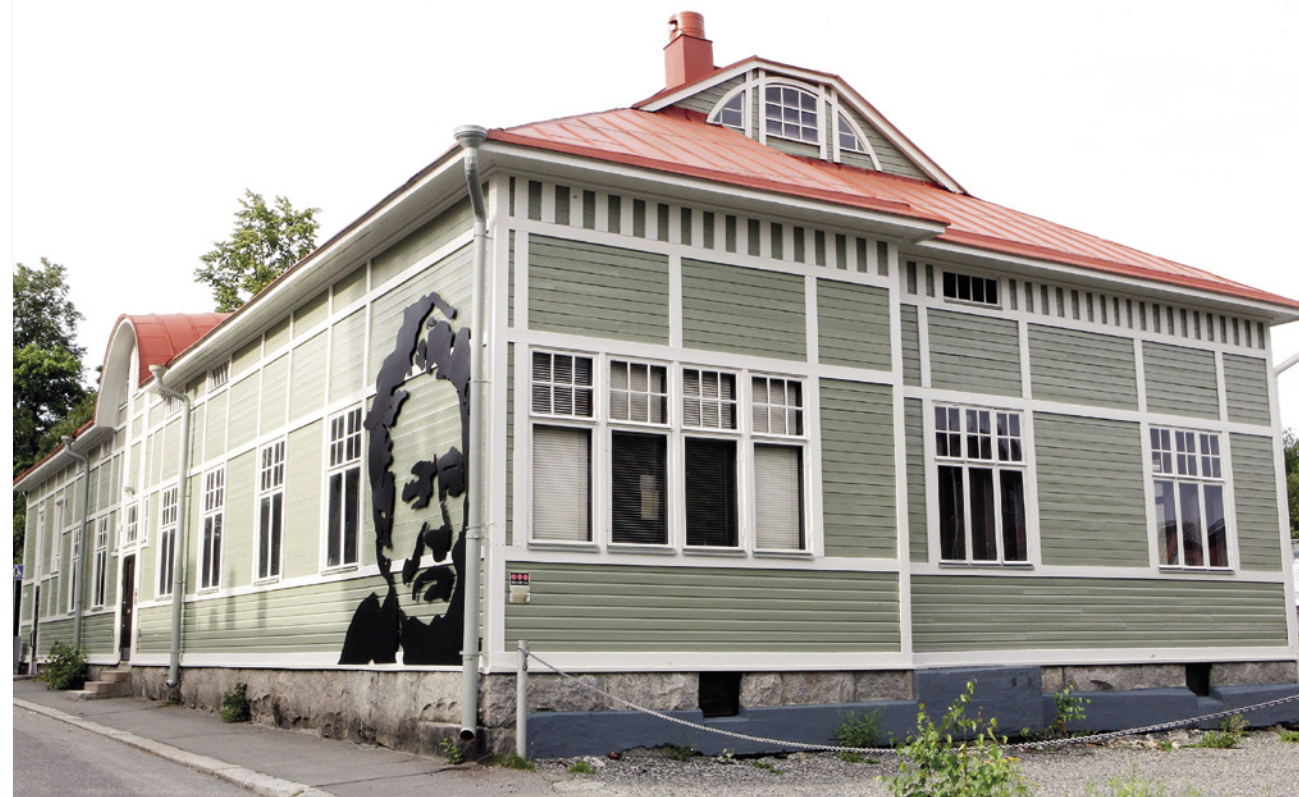
Kanttilan rakennus.

Paljon on jo neljän vuoden aikana 2016-2020 saatu hankkeessa aikaan. On tehty rakennushistoriallinen selvitys ja valittu pääarkkitehti, joka on arkkitehtitoimisto Arto Mattila. On käyty rahoitusneuvotteluja ja pyydetty rakennuttaja-, LVI- ja muita tarjouksia. Rakennukselle